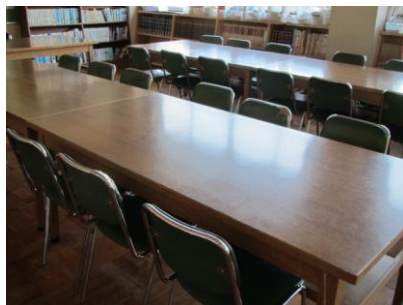
何もなかったテーブルの上が