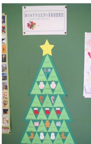
掲示物が増え、賑やかになりました