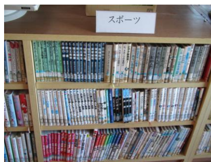
本の背表紙を前に出し、見出しをつけるだけで、本が身近に感じられるようになりました