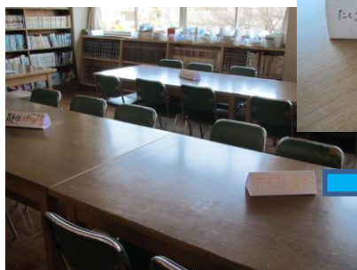
メッセージで温かい雰囲気