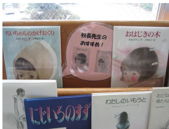
校長先生のお薦めの本