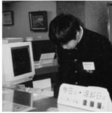
カウンター体験中です

平成十四年度、図書館見学や調べ学習で来館した学校は三十校、一、二五人に上りました。十三年度に比べて倍増となっており、今年度から始まった総合学習の影響とみています。見学の際には、「県立図書館の自慢」「利用する人に望むこと」などたくさん質問が寄せられました。後日いただいた感想文では、日頃見ることができない、古い新聞や本が整然と並んだ書庫の印象に触れたものが多かったようです。