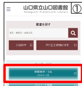
(スマートフォン版画面)