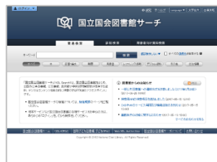
国立国会図書館サーチ

雑誌記事を探すには、ウェブサイト「国立国会図書館サーチ」を使うと便利です。（ http://iss.ndl.go.jp/ 、または「NDLサーチ」で検索）