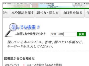
県立山口図書館なんでも検索

当館ウェブサイトの「蔵書検索（詳細検索）」や、館内の蔵書検索用端末で検索するときには、「件名」の欄に次のキーワードを入力すると、関係する資料をうまく探せます。